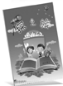
探之旅—少年圣经函授课