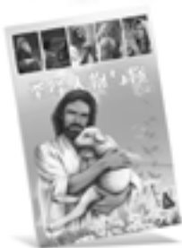
圣经人物与你 (新约)