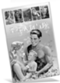
圣经人物与你 (旧约)