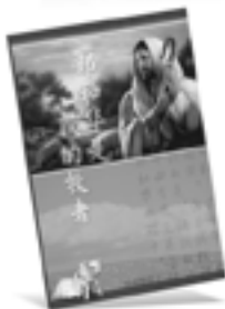
耶和华是我的牧者