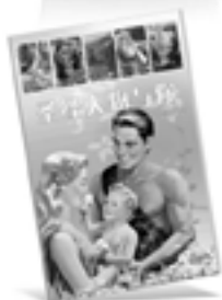
圣经人物与你 (旧约)