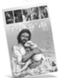
圣经人物与你 (新约)