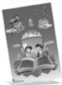
探之旅-少年圣经函授课